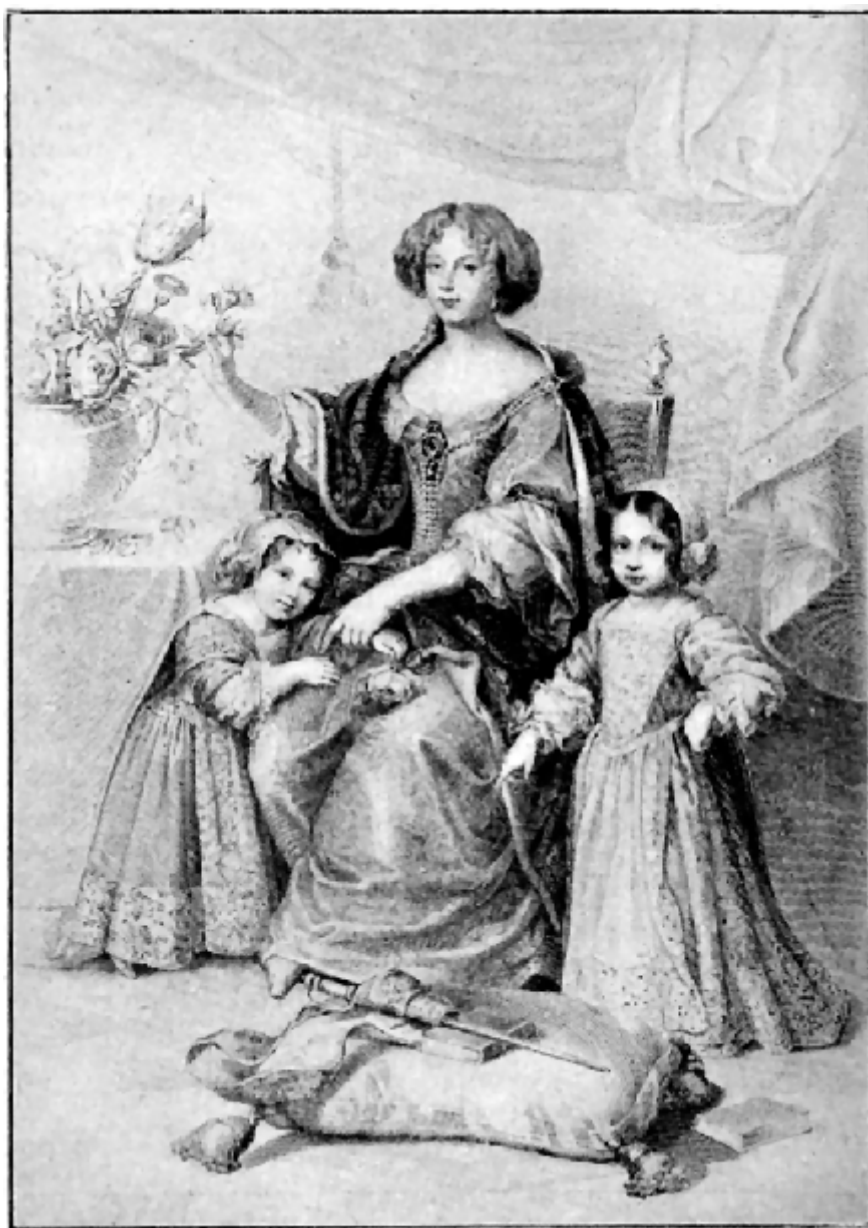
Elisabeth-Charlotte de Bavière, duchesse d'Orléans, princesse Palatine, et ses deux enfants.

quelque sorte, de repoussoir aux beautés fines et délicates de son temps. Aucune femme ne s'est, croyons-nous, mieux fait connaître que la princesse Palatine dans ses lettres. Elle y est tout entière, avec ses défauts et ses qualités, son curieux mélange d'austérité de mœurs et de cynisme de langage, ses hauteurs de grande dame et ses expressions de femme du peuple, son prétendu dédain pour les grandeurs humaines et son amour acharné pour les prérogatives du rang.