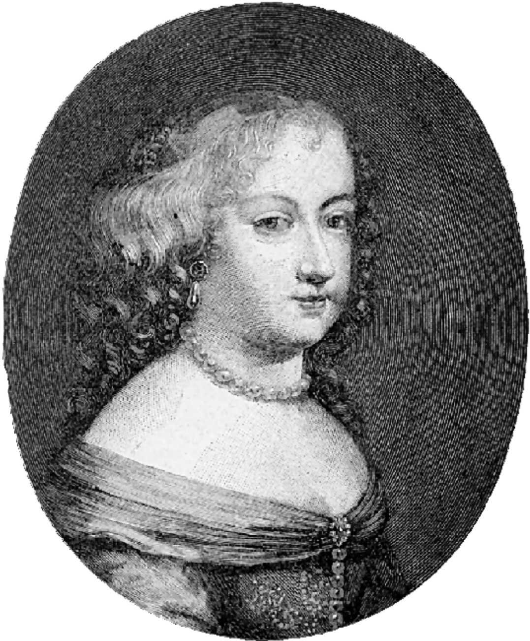
Marie-Thérèse d'Autriche, reine de France.

Au commencement de son mariage, Louis XIV la traitait non seulement avec de grands égards, mais avec une réelle tendresse. Lorsqu'elle devint mère du dauphin, le roi versa des