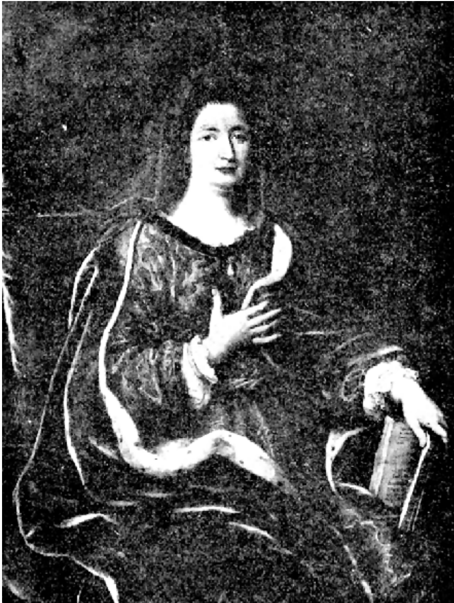
Mme de Maintenon.

Mme de Maintenon semblait au comble de ses vœux ; mais elle était trop intelligente, elle avait jeté sur les problèmes de la destinée humaine un regard trop scrutateur et trop inquiet, pour ne pas être en même temps saisie de tristesse. C'est elle qui écrivait : « Avant d'être à la cour, je pouvais me rendre témoignage que je n'avais jamais connu l'ennui ; mais j'en ai bien tâté depuis, et je crois que je n'y pourrais résister si je ne pensais que c'est là où Dieu me veut. Il n'y a de vrai bonheur qu'à servir Dieu. »