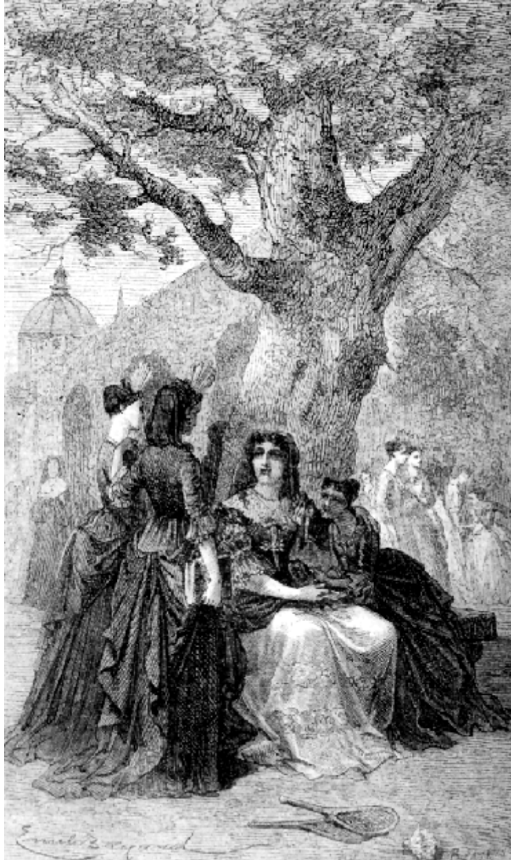
Mme de Maintenon à Saint-Cyr.

Les dames de Saint-Louis, – c'est ainsi qu'on appelait les religieuses de la maison de Saint-Cyr, avaient, dans le milieu de la journée, une heure de récréation qu'elles passaient ordinairement autour d'une grande table, à converser librement en travaillant à l'aiguille. Mme de Maintenon aimait à venir à ces récréations ; elle y apportait son ouvrage et s'y livrait à des entretiens, à la fois spirituels et édifiants, dont la communauté appréciait le charme instructif.